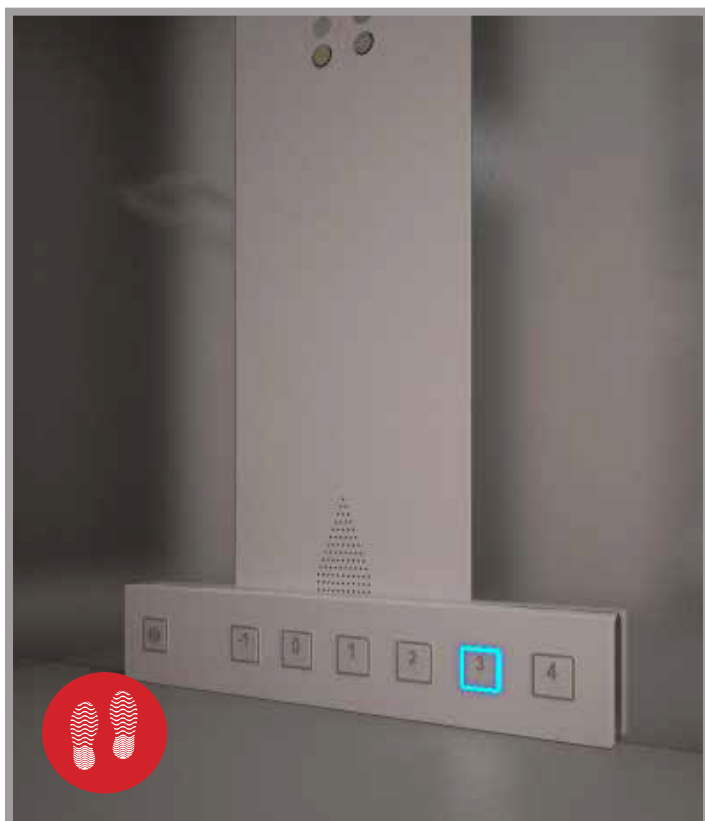
1. pulsantiera di cabina

È realizzata con pulsanti antivandalo ed è un prodotto su misura e personalizzabile in base alle esigenze del cliente.